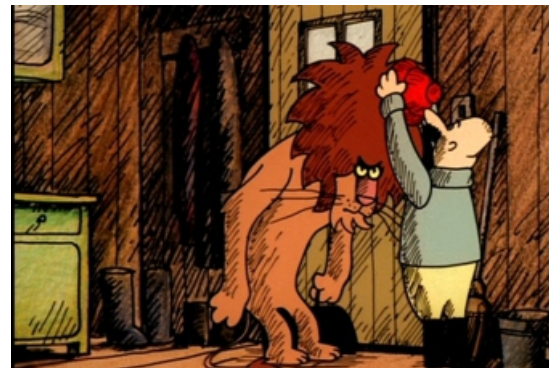
AVEC L'ARRIVÉE DE L'HIVER LÉO SE TRANSFORME EN LION DES NEIGES, Pal Toth

Mais pour s'adapter à l'hiver, les animaux doivent aussi se mettre à l'abri des intempéries (la pluie dans Novembre ), et surtout du froid, en ralentissant par exemple leur activité. C'est le cas de l'ours ( Histoires d'ours ) ou du loir ( Des pas dans la neige ), mais l'hibernation n'est pas la seule solution pour se protéger du froid : le lion Léo et son ami Fred ont la chance d'avoir un poêle et le petit garçon de Flocon de neige est équipé d'un bonnet, de moufles et d'une écharpe, bien utiles à des animaux de la savane !